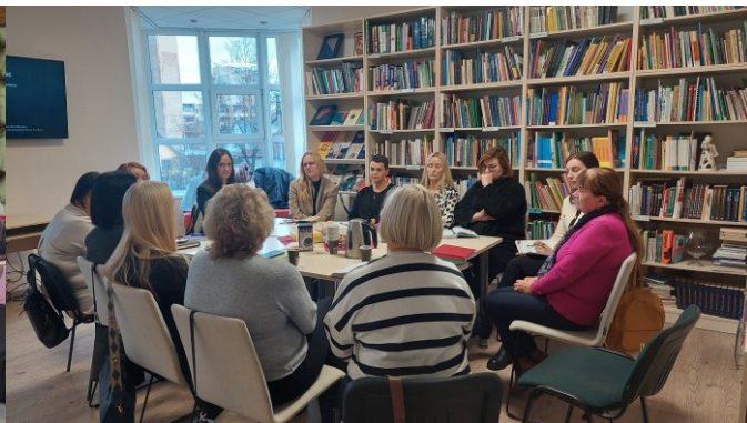
Ikimokyklinio ir priešmokyklinio ugdymo mokytojų metodinė diena Švietimo centre, 2024 m. lapkritis