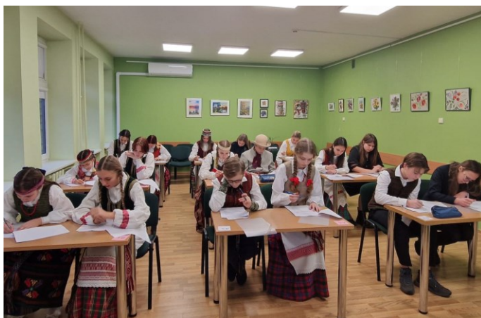
Lietuvos mokinių etninės kultūros olimpiada Švietimo centre, 2024 m. gruodžio mėn.

Organizuojant olimpiadas ir konkursus įstaiga glaudžiai bendradarbiavo su rajono mokyklų mokytojais ir įvairiomis švietimo įstaigomis: VDU, KTU, Vilniaus dailės universitetu, Kauno technologijų mokymo centru, Kauno maisto pramonės ir prekybos mokymo centru bei Kauno kolegijos Menų ir ugdymo fakulteto Menų akademija.