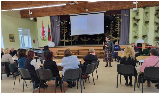
Mokyklų direktorių pavaduotojų ugdymui metodinė diena Garliavos A. Mitkaus pagrindinėje mokykloje, 2024 m. kovas

Efektyviai dirbo mokyklų direktorių pavaduotojų ugdymui veiklos grupė: jiems buvo organizuotos 5 metodinės dienos: „Pamokos vertinimas“ Karmėlavos B. Buračo gimnazijoje, „Įsivertinimas pamokoje“ Garliavos A. Mitkaus pagrindinėje mokykloje, „Diferencijavimas ir individualizavimas“ Zapyškio pagrindinėje mokykloje, „Skaitymo strategijos. Integruotas ugdymas“ Neveronių gimnazijoje, „Įtraukusis ugdymas. Gabių vaikų ugdymas“ Akademijos mokykloje-darželyje „Gilė“. Metodinių dienų metu analizuotos atviros pamokos, gerosios patirties pranešimai patobulino direktorių pavaduotojų ugdymui profesinę kvalifikaciją, pamokų vertinimo kokybę.