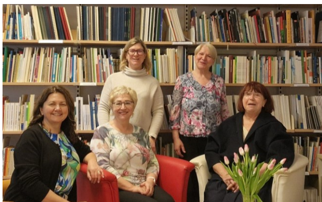
Darbo stebėjimo vizitas Slovėnijos trečiojo amžiaus universitete Liublianoje, 2024 m. balandžio mėn.

Projektų, kaip ir kvalifikacijos tobulinimo programų, tema buvo susijusi su ES, Lietuvos ir Kauno rajono savivaldybės švietimo bei kultūros prioritetais bei atliepė strateginių bei metinių planų tikslus. 2024 m. Centras vykdė 11 projektų, iš kurių 6 yra tarptautiniai (KA220 ir KA1) ir 5 regioniniai. Užbaigti du Erasmus+KA220 Strateginių partnerysčių projektai: MEDUS „Inovatyvūs būdai ir metodai, dirbant su iš emigracijos grįžusiais ir atvykusiais mokiniais, siekiant maksimaliai didinti jų socialinę įtrauktį ir mokymosi efektyvumą“, kurio tikslas buvo tobulinti mokytojų ir pagalbos mokiniui specialistų profesines kompetencijas, siekiant sukurti palankią mokymosi, socialinę ir emocinę aplinką migrantų vaikams ir „Hibridinio mokymo metodika andragogams“, kurio tikslas – įgalinti suaugusiųjų švietėjus įgyvendinti hibridinį mokymąsi bei naudotis virtualiais asistentais. Buvo tęsiamas „Up2DigiSchool – perspektyvus pedagoginis požiūris į skaitmeninį mokyklinį ugdymą“, kurio tikslas padėti ugdyti naujus mokinių skaitmeninius įgūdžius bei kompetencijas ir suteikti galimybę mokytojams išmėginti naujas priemones ir pedagoginius metodus skaitmeniniame ugdyme. Centras toliau vykdė koordinuojamą Erasmus+KA220 projektą DigFinLit „Suaugusiųjų skaitmeninio finansinio raštingumo didinimas, siekiant socialinės, ekonominės įtraukties ir lygybės“, kurio tikslas yra didinti suaugusiųjų skaitmeninio finansinio raštingumą.