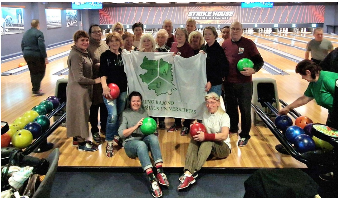
Kauno rajono TAU sporto fiesta, 2024 m. lapkričio mėn.

Kauno rajono trečiojo amžiaus universitete (TAU) veikia 16 fakultetų, kuriuos lanko 606 registruoti vyresnio amžiaus žmonės (2023 m. – 500 senjorų). 2024 m. suorganizuotos 224 paskaitos ir praktiniai užsiėmimai įvairiomis temomis: sveikatos stiprinimas, fizinis aktyvumas, finansinis raštingumas, saugi aplinka bei gamtosauga, meno terapija, prasmingo gyvenimo vedimas vyresniame amžiuje, tvarus vartojimas ir kt., 15 išvykų Lietuvoje ir 3 išvykos į užsienį, 5 – į Lietuvos teatrus. Tradiciniais tapusiuose renginiuose: romansų popietė, sporto fiesta, kryžiažodžių sprendimo turnyras, kaukių balius, protmūšiai, dalyvavo 675 senjorai.