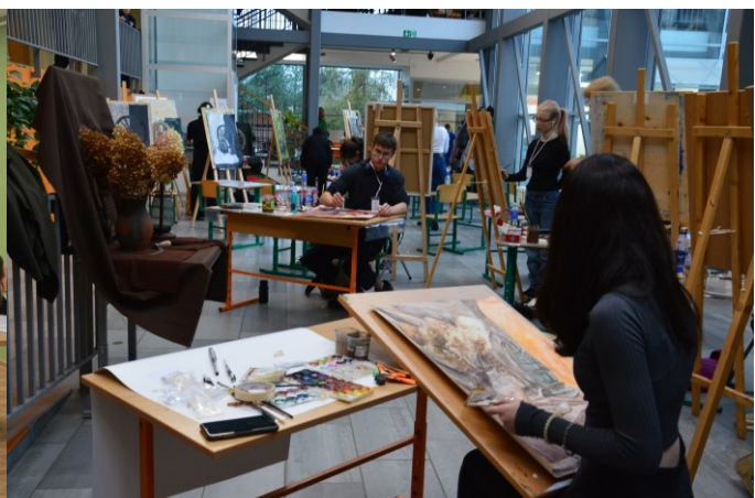
Respublikinis dailės konkursas „Rudens natūrmortas Lapių pagrindinėje mokykloje, 2024 m. lapkričio mėn.