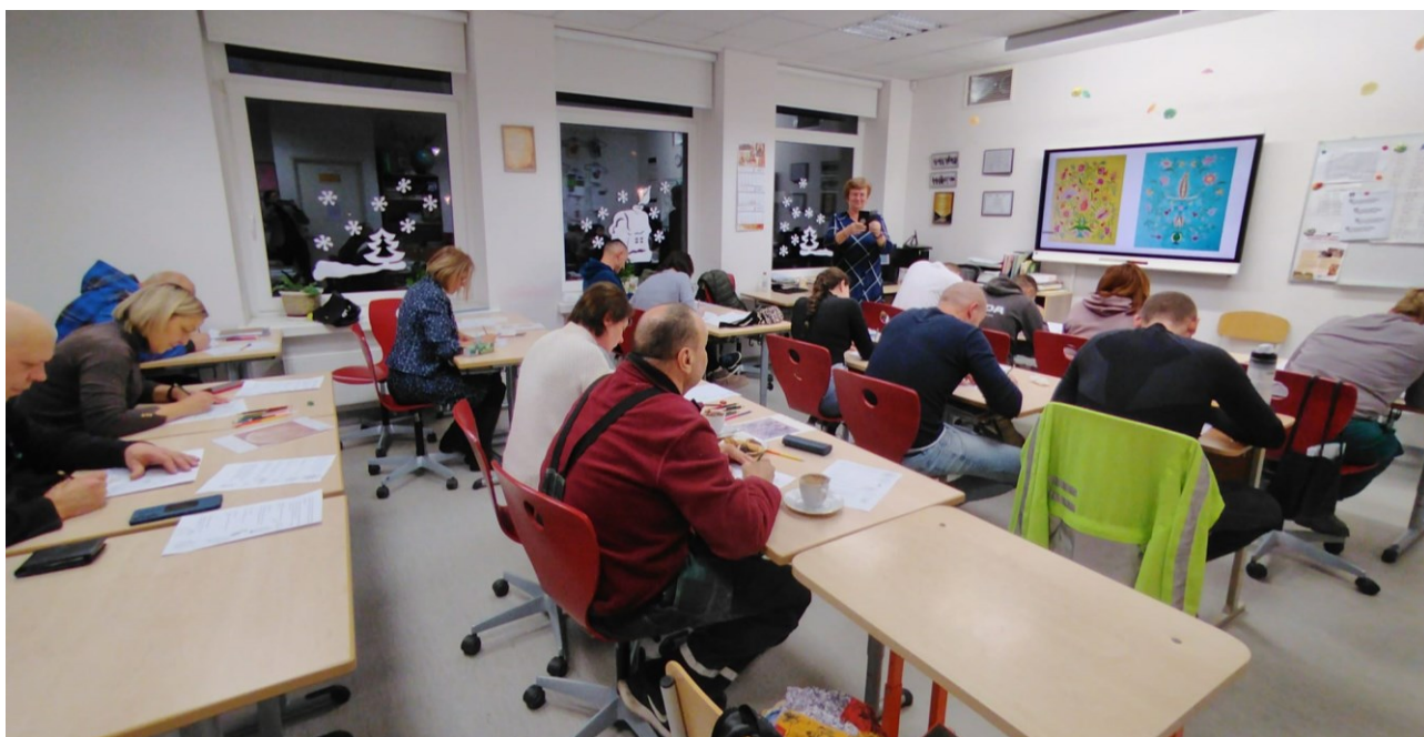
Lietuvių kalbos kursai ukrainiečiams Taurakiemio seniūnijoje, 2024 m. rugsėjo-lapkričio mėn.

Ežerėlio ir Taurakiemio seniūnijose, bendradarbiaujant su Kauno Užimtumo tarnyba, buvo organizuoti 2 lietuvių kalbos A1 lygio kursai (90 val.) ukrainiečiams (33 dalyviai).