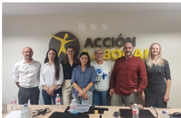
Projekto DigFinLit partnerių susitikimas Valadolide (Ispanijoje), 2024 m. spalio mėn.

Taip pat vykdė 2 Erasmus+KA1 mobilumo projektus pagal patvirtintą 5-erių metų strategiją. Mokytojai ir suaugusiųjų švietėjai bei besimokantieji (20 dalyvių) tobulino andragogikos ir anglų kalbos žinias Europos švietimo organizacijose. Šiais metais įgyvendinti ir 5 regioniniai projektai Trečiojo amžiaus universiteto dalyviams ir fakultetų prorektoriams: „Teatro terapija“, „Vaidmenų pasaulis“, „Linoraižinio paslaptis“, „Gaminti gali visi“, „Kauno rajono trečiojo amžiaus universiteto studentų sveikatos stiprinimas ir švietimas“.