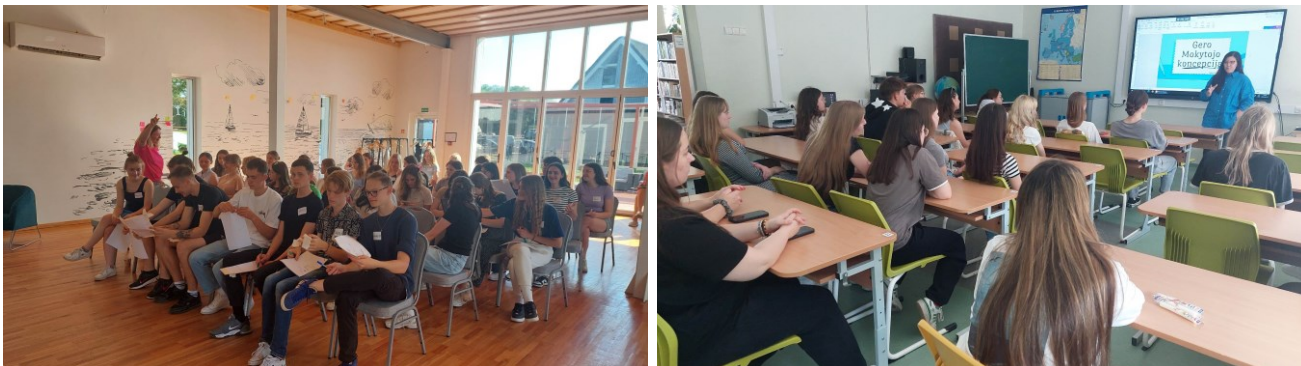
JPK stovykla Klaipėdos r., 2024 m. gegužės mėn.

2024 m. organizuota 15 įvairių renginių: 5 paskaitos pedagogine ir psichologine tema, 6 edukacinės išvykos į A. ir A. Kriauzų pradinę mokyklą, Kačerginės mokyklą-daugiafunkcį centrą, VDU Švietimo akademiją ir VDU darželį „Mažųjų akademija“, į LR Seimą, Klaipėdos r. I. Simonaitytės gimnaziją ir Klaipėdos kolegijos pedagoginį fakultetą; 3 susitikimai su jaunais ir patyrusiais mokytojais, VDU dėstytojais; 2-jų dienų pedagoginė stovykla su Klaipėdos r. JPK mokiniais Drevernoje.