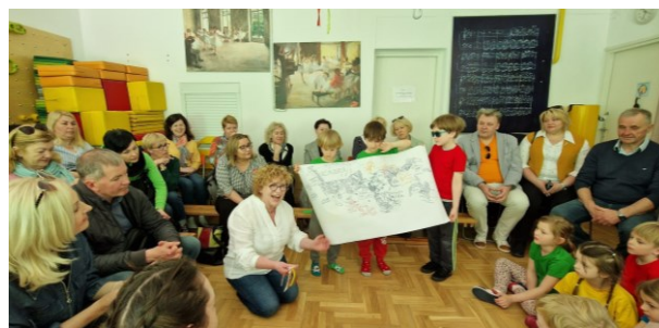
Švietimo įstaigų vadovų edukacinė stažuotė Lenkijos ugdymo įstaigose, 2024 m. gegužės mėn.

Šiais metais didžiausias dėmesys buvo skiriamas pradinėms klasių ir informatikos mokytojams: pradinėms klasių mokytojais (151 dalyvis) kiekvieną mėnesį dalyvavo „profesiniuose dialoguose“, kaip tobulinti mokinių skaitymo ir matematikos įgūdžius; 17 informatikos mokytojų tobulino programavimo įgūdžius pagal kvalifikacijos tobulinimo programą „Python programavimas“. Sėkmingai bendradarbiaujant su KTU aptarti aktualūs klausimai dėl tęstinio informatikos mokytojų tobulinimo kursų ir abiturientų, besiruošiančių laikyti informatikos VBE, konsultacijų. Siekiant patobulinti gamtos ir tikslųjų mokslų mokytojų kvalifikaciją bei pagerinti minėtų dalykų mokinių mokymosi pasiekimus, 2024 m. rudenį susitarta su VDU STEAM didaktikos centru dėl mokytojų dalyvavimo nacionalinėse STEAM ir matematikos programose.