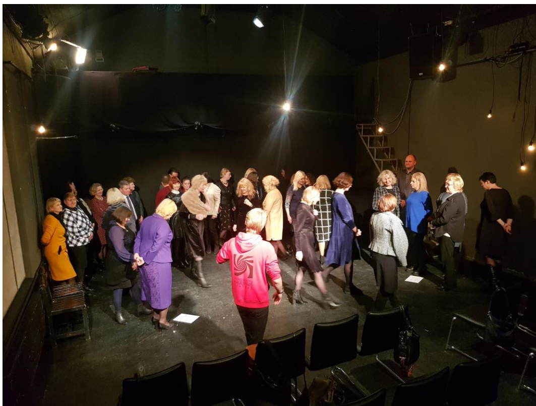
Metodinių būrelių ataskaitinis renginys Kauno kameriniame teatre

2022 metais organizuotos 6 konferencijos, kuriose dalyvavo 570 dalyvių, iš jų 112 mokytojų iš Kauno rajono ir 458 – iš kitų savivaldybių. Net 3 konferencijos buvo skirtos Erasmus+ projektų sklaidai, išryškinant projektinės veiklos poveikį mokinių mokymosi rezultatams. Organizautos 2 konferencijas respublikos mastu: Lietuvos mokyklų bibliotekų darbuotojams ir Lietuvos kūno kultūros mokytojų asociacijos nariams. Pagalbos mokiniui specialistai organizavo tradicinę idėjų mugę. Vyko 4 apskritojų stalo diskusijos ugdymo turinio atnaujinimo ir mokinių pasiekimų gerinimo klausimais, jose dalyvavo 43 Kauno rajono mokytojai ir pagalbos mokiniui specialistai. Šiomet nepasizymėjo gausa atvirų pamokų demonstravimas: tik 4 atviros pamokos, kurias stebėjo 27 Kauno rajono mokytojai. Norėtusi, kad šis skaičius būtų didesnis, nes mokytojams įvaldžius informacines technologijas, pamokas organizuoti nuotoliniu būdu tapo paprasčiau, nereikia spręsti logistikos klausimų, derinti išvykimą iš pamokų.